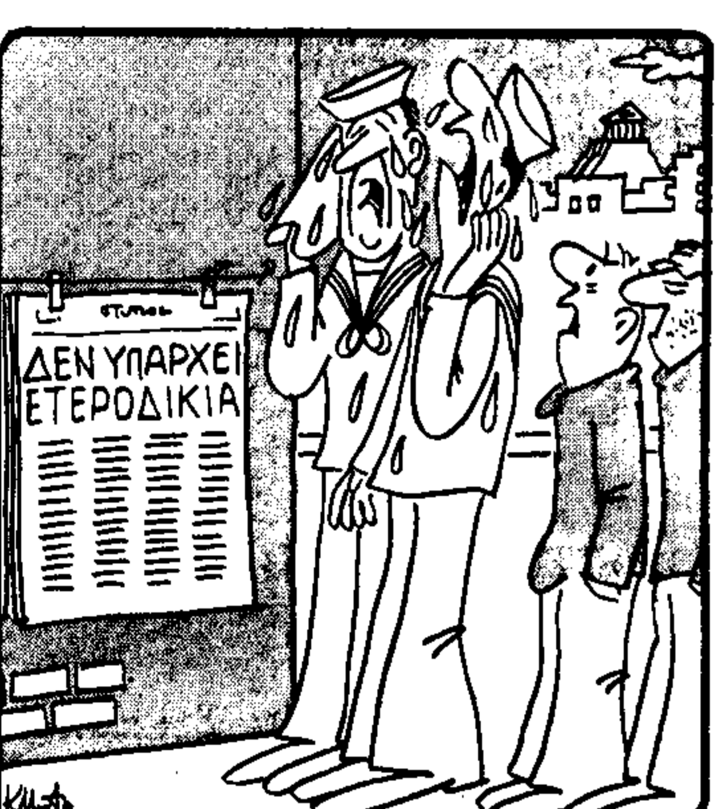
Πικραστά, τό χάραξε ο 'Αμερικάνοι!...